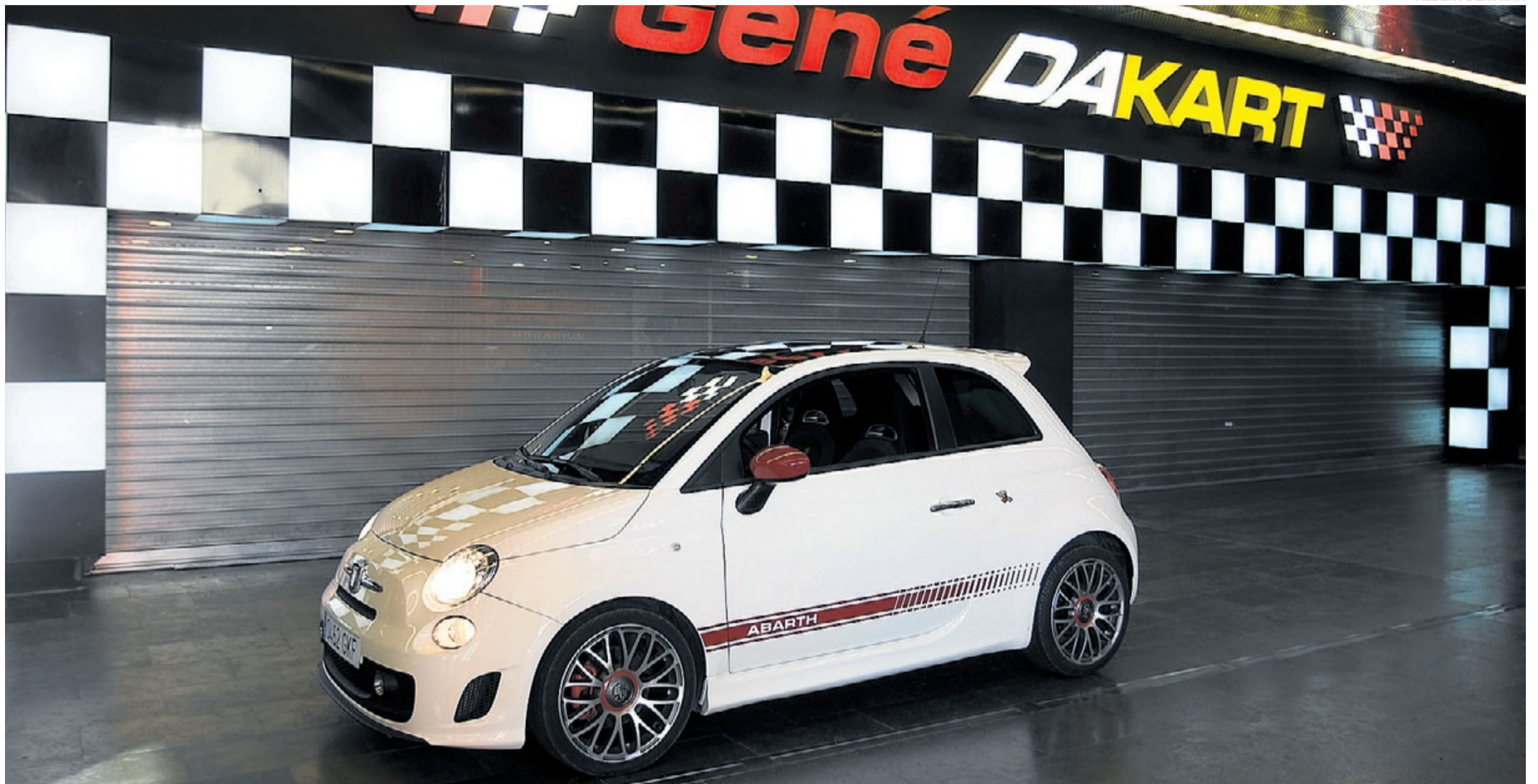
DE CARRERAS. En las instalaciones del Gené Dakart estuvimos tentados de hacer unas vueltas con el 500 Abarth y competir de tú a tú contra los karts en la pista